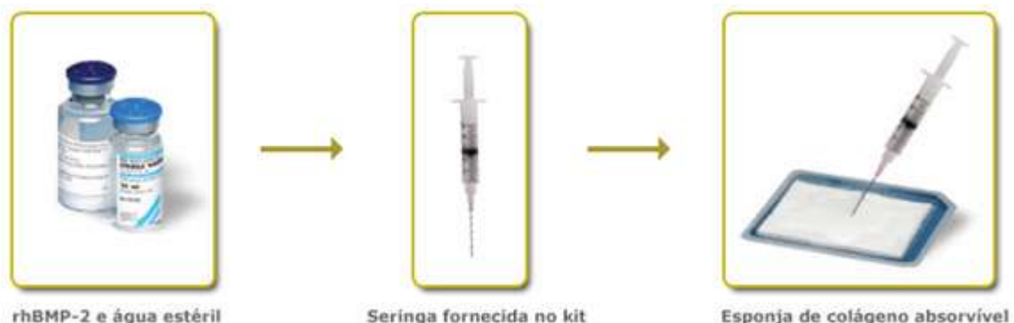
Figura 3: Kit fornecido pelo fabricante. 7

A técnica de enxerto alveolar com rhBMP-2 apresenta como vantagens em relação à técnica de enxerto autógeno obtido da crista ilíaca, uma menor morbidade pós-operatória, eliminação da necessidade de uma segunda área doadora, dispensa da necessidade de outro profissional da área médica, simplifi-