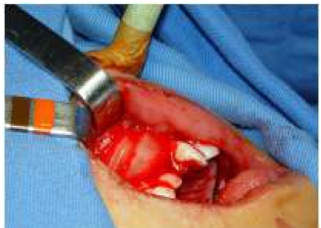
Figura 5D: Acomodação das membranas na área da fissura.