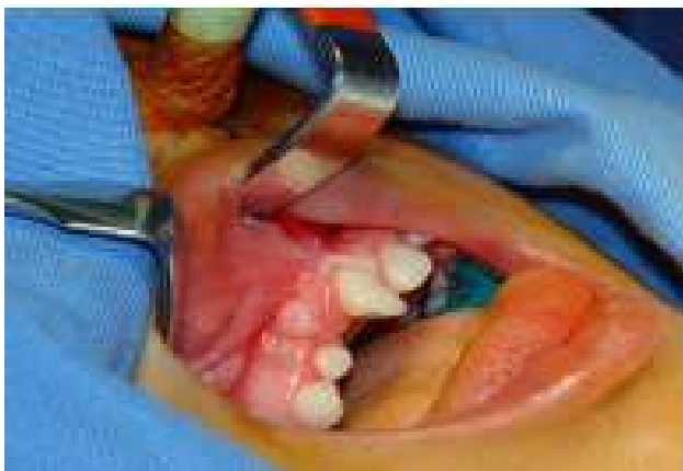
Figura 5A: Defeito anatômico localizado entre os dentes Incisivo Central superior permanente direito e Incisivo Lateral decíduo superior direito.