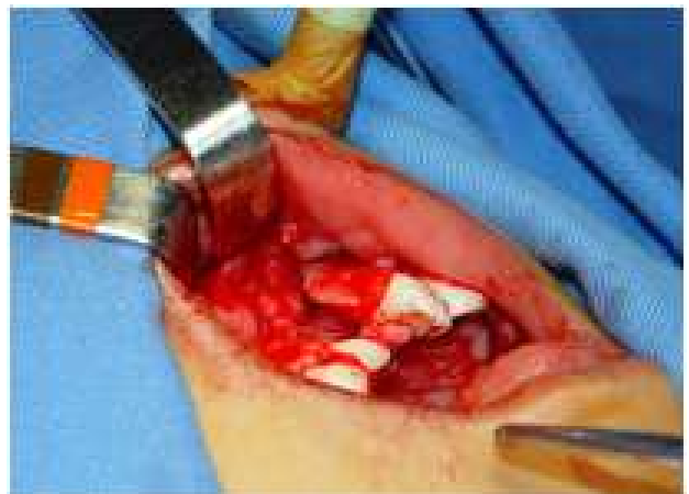
Figura 5C: Descolamento de retalho mucoperiosteal, do assoalho nasal e sutura do assoalho nasal.