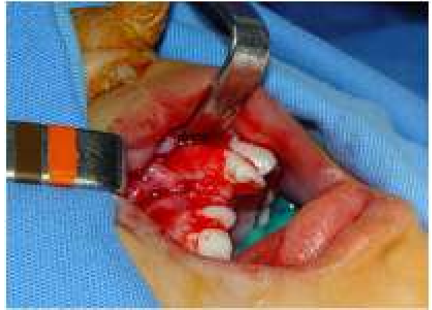
Figura 5B: Retalho dividido com incisão oblíqua a partir da mesial do dente 1º Molar permanente.

A técnica cirúrgica empregada pela equipe de cirurgia bucomaxilofacial do HRAC/USP para as cirurgias de enxerto alveolar com rhBMP-2 (Figuras 5A, 5B, 5C, 5D e 5E) é a mesma utilizada nas cirurgias de enxerto ósseo medular de crista ilíaca.