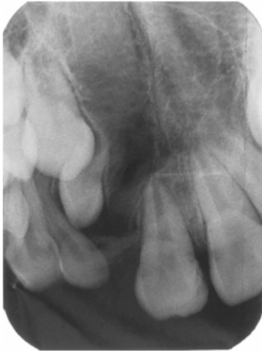
Figura 4: Defeito ósseo no rebordo alveolar.

cação do tratamento, além de isentar-se do limitante físico da quantidade de osso da área doadora, apresentando índices de sucesso semelhantes aos de enxerto autógeno de crista ilíaca. 5