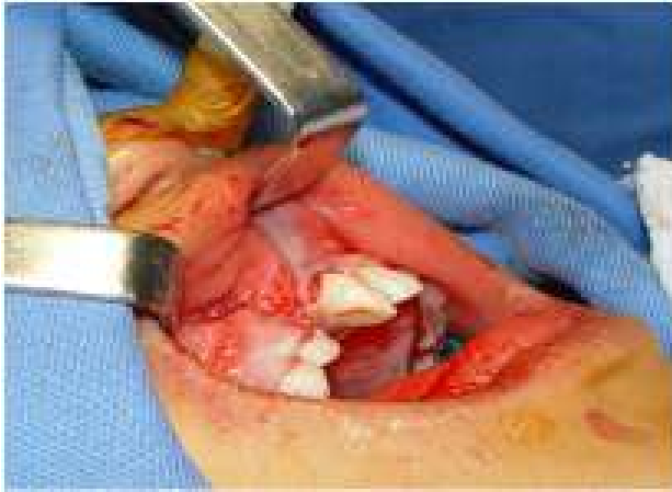
Figura 5E: O retalho vestibular é reposicionado até o total recobrimento do biomaterial (rhBMP-2) e de toda extensão óssea divulsionada, sem tensão; suas bordas são debridadas sendo então realizada a sutura com pontos simples.

Contudo, apesar de suas diversas vantagens, a cirurgia de enxerto com rhBMP-2 representa um grande desafio para aplicação nos serviços públicos de saúde em função de seu elevado custo, estando disponibilizado para a venda o kit em um valor aproximado de R$ 10.000,00 pela empresa fabricante. Vale ressaltar ainda que um kit é utilizado em sua totalidade para um paciente com fissura completa bilateral, com possibilidade de divisão na aplicação em dois pacientes com fissura completa unilateral. 18